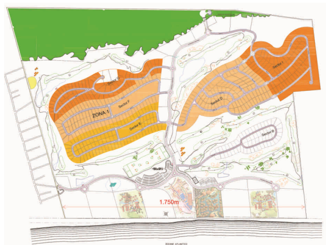
Figura 2: Master Plan - Aquiraz Riviera

Embora só seja possível avaliar as consequências da implantação com a concretização e funcionamento completo do empreendimento, é possível estimar que os impactos ambientais e socioespaciais resultantes deste resort serão de grande magnitude, concorrendo para a segregação socioespacial.