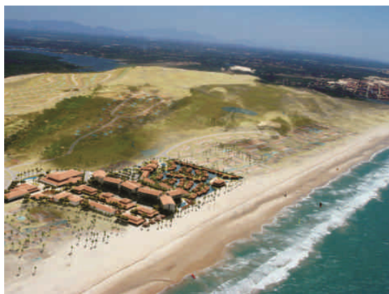
Figura 3: Projeto Hotel Pedro Laguna - Aquiraz Riviera

Fonte: Nasser Hissa Arquitetos Associados.