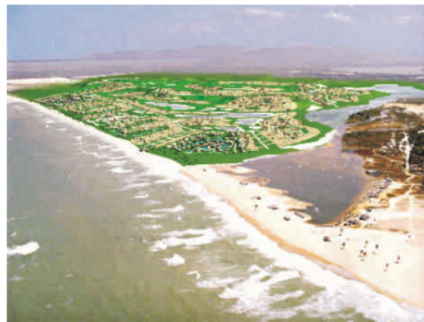
Figura 5: Imagens Projeto - Cumbuco Golf Resort