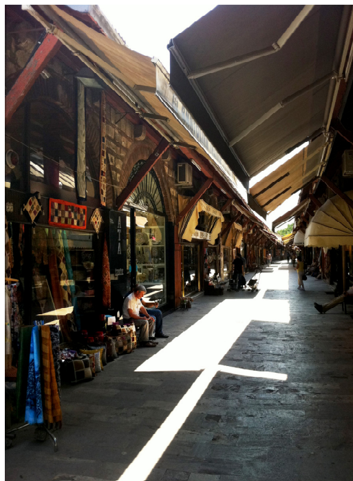
3 o LUGAR – Arrasta Bazar- Istambul- Autor – Orete Bortolli