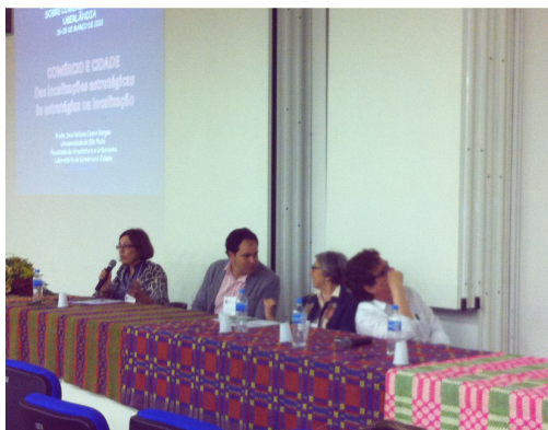
MESA REDONDA - Intervenções urbanas. Por quê e como intervir?