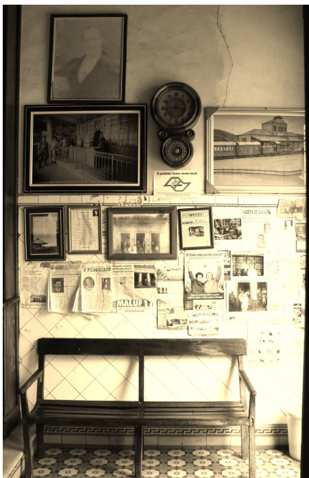
1 o LUGAR – Pharmacia Popular Autor– Tania Tombi