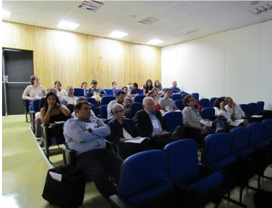
Sessão “Conversa com os autores” com a presença dos palestrantes.

Houve ainda a sessão de relatos dos coordenadores de mesa das sessões temáticas do evento, possibilitando uma visão geral dos trabalhos apresentados.