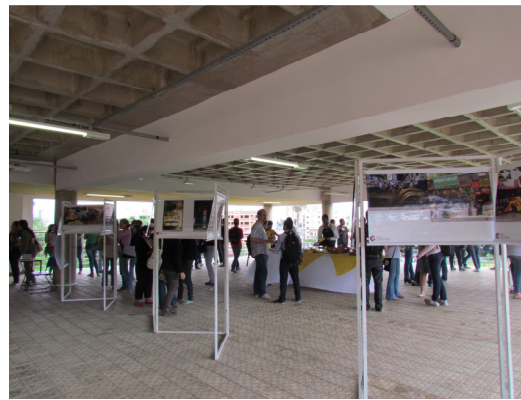
UFU –EXPOSIÇÃO “ O lugar do mercado e a imagem da troca”

Houve grande participação na escolha e foram indicadas as três melhores fotos