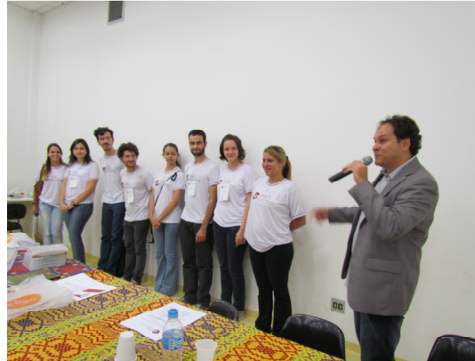
Sessão de premiação e encerramento

Para além das conferências e apresentação de trabalhos e livros, o evento realizou outras atividades: